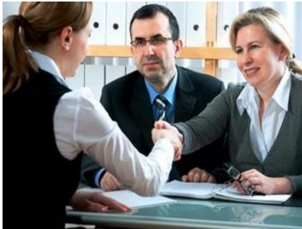
Gambar 21: Ketidaktelitian saat menyusun CV bisa membuat perekrut kecewa, lho.

Berbagai pertanyaan diajukan pewawancara saat interview. Ada pertanyaan yang mungkin sulit. Banyak juga pertanyaan yang sebenarnya sederhana. Sulit atau sederhana, sudah pasti pertanyaan-pertanyaan ini akan membuat kita sedikit banyak harus berpikir.