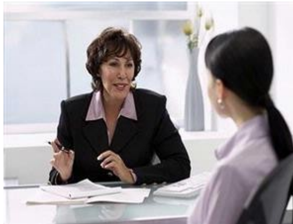
Gambar 20: 8 Pertanyaan Jebakan Saat Wawancara. (Image by Getty Images).

Sebagian besar pemburu pekerjaan mengakui mengalami perasaan yang beraneka ragam, mulai dari perasaan tidak tenang sampai rasa panik berlebihan. Supaya tidak panik, ikuti beberapa tip sederhana berikut ini.