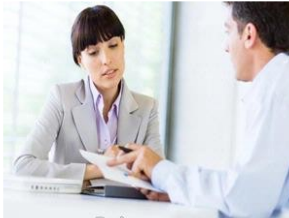
Gambar 18: Mengatasi Panik Saat Interview.

Akhirnya Anda menerima panggilan untuk wawancara di sebuah perusahaan yang sudah lama Anda impikan. Awalnya Anda merasa excited, namun lama-lama berubah menjadi tegang dan panik. Baru memasuki gedungnya yang megah saja Anda sudah minder. Apalagi ketika bertemu dengan karyawan-karyawannya yang terlihat begitu sophisticated. Saat memasuki ruang wawancara, Anda ternyata dihadang lima pimpinan perusahaan. Wuaah... Apa yang harus saya lakukan? Bagaimana mengatasi ketegangan ini?