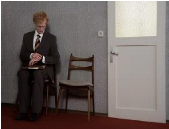
Gambar 4: Pastikan Anda hadir sebelum waktu yang ditetapkan untuk menenangkan diri dan mempersiapkan penampilan.

Selamat! Berarti surat lamaran dan curriculum vitae Anda berhasil mengambil hati perusahaan tersebut. Langkah berikutnya? Wawancara kerja. Di saat ini, perusahaan ingin melihat secara langsung apakah Anda cocok untuk pekerjaan ini atau tidak. Persiapkan diri Anda untuk maju dan bertemu orang yang akan menentukan maju atau tidaknya Anda ke tahap berikut. Berikut tips yang disajikan Jane Buckingham dari The Modern Girl's Guide to Life untuk menghadapi wawancara kerja.