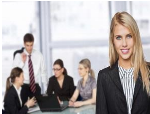
Gambar 26: Jadikan diri lebih diterima di antara rekan-rekan kerja baru.

Akhirnya, setelah sekian banyak proses perekrutan, Anda termasuk sebagai orang yang dianggap layak untuk bekerja di perusahaan yang diincar banyak pelamar kerja. Ini merupakan kesempatan baik, masa depan Anda ditentukan mulai dari detik ini. Sementara, ini merupakan teritori baru. Jika Anda tak memiliki kenalan siapa pun di kantor tersebut, apa yang harus dilakukan?