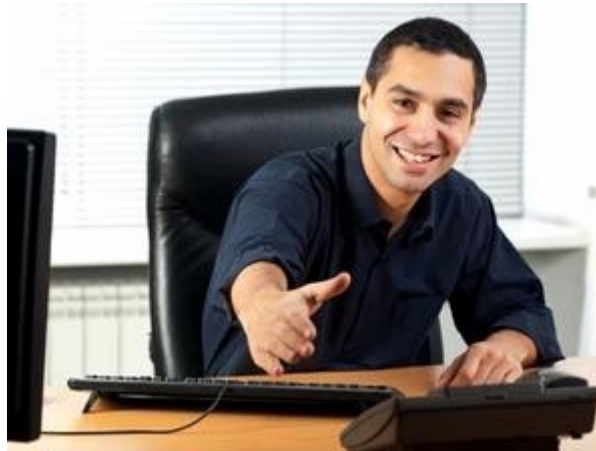
Gambar 1: Anda merasa mampu membuat pewawancara terkesan dengan jawaban-jawaban Anda, tetapi mengapa pekerjaan tersebut gagal Anda raih.

Anda merasa sudah memenuhi kriteria yang disyaratkan dalam iklan lowongan pekerjaan, atau berhasil meyakinkan pewawancara dengan jawaban yang memuaskan, tetapi kenapa pekerjaan impian tersebut lepas dari tangan Anda?