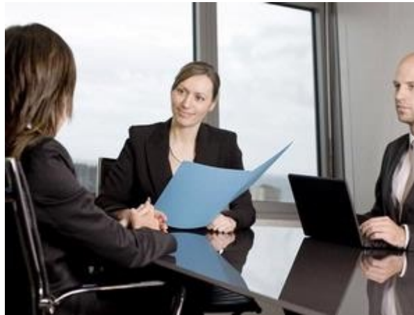
Gambar 3: Ok... saya pasti bisa menjawab pertanyaan ini kok.

Pewawancara akan selalu meneliti pelamar dari surat lamarannya, cara menjawab panggilan telepon, dan saat wawancara. Jangan sampai upaya Anda untuk mendapatkan pekerjaan incaran hilang. Berikut adalah hal-hal yang perlu Anda hindari: