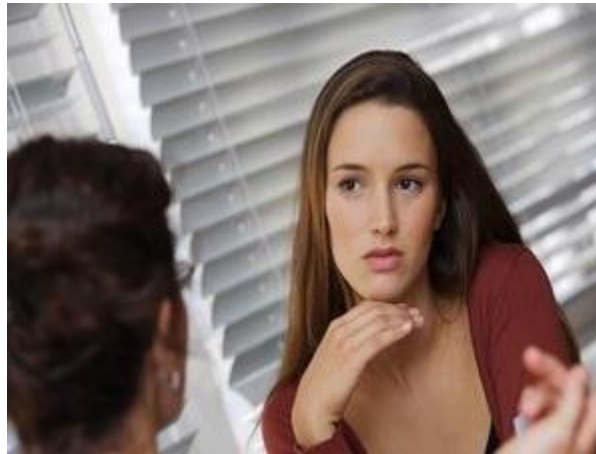
Gambar 17: Tips Menghadapi Wawancara Kerja.

Bagi yang tengah mencari pekerjaan, mendapat kesempatan untuk wawancara kerja sangatlah menyenangkan. Namun, kebahagiaan ini jangan sampai menodai acara wawancara itu sendiri. Perlu diingat, wawancara kerja amat penting karena menentukan keberhasilan Anda mendapatkan pekerjaan impian.