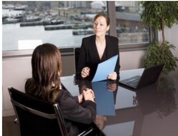
Gambar 25: Pakaian sopan dan sesuai, sikap tubuh yang tenang, dan pertanyaan cerdas, pasti membuat Anda diterima di perusahaan idaman itu.

Tak perlu menunggu lama untuk mengetahui wawancara kerja Anda berhasil atau gagal. Anda bisa menilai beberapa detik setelah wawancara berlangsung. Berikut adalah beberapa tanda bahwa hasil wawancara berhasil atau sebaiknya dilupakan saja.