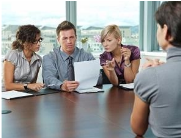
Gambar 7: Saat diwawancara lebih dari 1 orang, jangan lupa untuk merespon kepada penanya, tetapi sesekali tatap pula orang lain yang ada di ruangan. (Image by Shutterstock).

Mendapat panggilan wawancara kerja bersama beberapa kandidat lain? Ehm, persaingan ketat, ya? Merasa pintar dan "siap" saja tidak cukup untuk memenangkan sesi ini. Anda tetap perlu mencari tahu apa trik sukses wawancara kerja agar bisa menjadi yang terpilih.