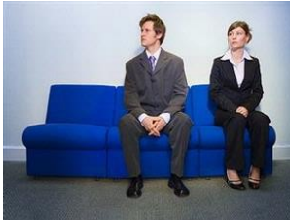
Gambar 11: Wajib Tahu agar Sukses Wawancara

Setelah melakukan networking, mengirimkan resume, dan menunggu dengan sabar panggilan wawancara kerja, akhiri usaha Anda dengan mempersiapkan diri sebaik mungkin. Untuk mengetahui kesiapan Anda dalam menangkap peluang kerja, ikuti kuis berikut ini.