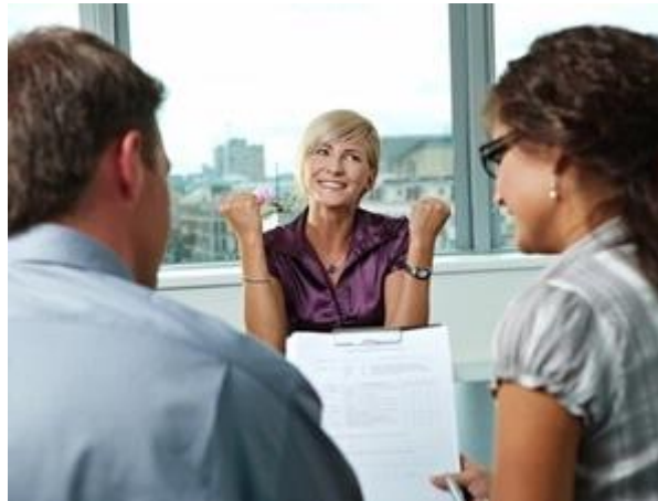
Gambar 2: Anda senang bisa menjawab pertanyaan dengan santai, bahkan bercanda dengan pewawancara. Tetapi kok, Anda tidak diterima di perusahaan itu ya? (Image by Shutterstock).

Sesi wawancara di perusahaan baru memang menjadi momen yang paling mendebarkan. Anda khawatir tak akan bisa memberikan jawaban yang memuaskan. Jadi ketika Anda bahkan bisa bercanda dengan pewawancara, atau meninggalkan kantor tersebut dengan perasaan puas dan percaya diri, Anda merasa yakin pasti akan diterima bekerja. Tetapi ternyata, hari demi hari, minggu demi minggu, Anda tak juga menerima kabar baik tersebut. Kira-kira, apa yang salah dari diri Anda ya?