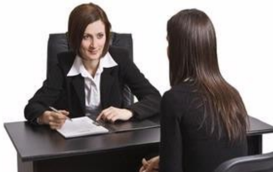
Gambar 15: Tanya Apa Saat Wawancara Kerja? (Image by Shutterstock).

Umumnya, saat wawancara kerja, perusahaanlah yang bertanya kepada si pelamar. Namun, di akhir wawancara kerja, biasanya pelamar diberikan kesempatan untuk bertanya. Semua artikel tentang pekerjaan menyarankan untuk memanfaatkan kesempatan untuk bertanya. Namun, apa yang sebaiknya kita tanyakan di saat krusial seperti itu?