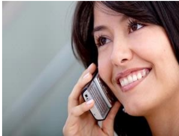
Gambar 23: Wawancara via telepon, gampang-gampang susah. Perlu persiapan agar sukses melaluinya.

Umumnya wawancara kerja memang dilakukan secara face to face di perusahaan terkait, tapi ada kalanya prosedur wawancara kerja dilakukan via telepon. Biasanya, wawancara kerja seperti ini dilakukan secara face to face di perusahaan terkait, tapi ada kalanya prosedur wawancara kerja dilakukan via telepon. Biasanya, wawancara kerja seperti ini dilakukan bila perusahaan berada di luar kota atau luar negeri untuk menghemat waktu dan biaya. Tapi ada kalanya, beberapa perusahaan memilih wawancara via telepon sebagai proses penyaringan awal para kandidat karyawan, sebelum mengundang mereka langsung untuk wawancara tatap muka.