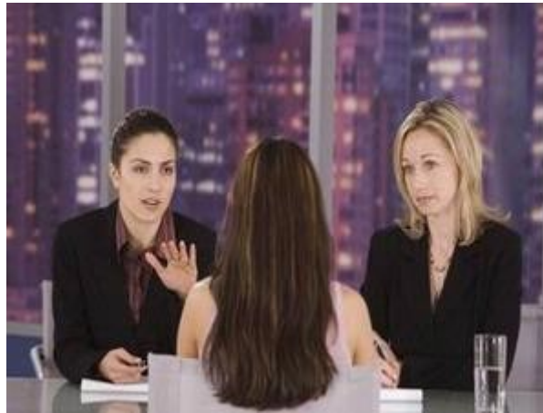
Gambar 13: Yang Perlu Anda Tanyakan Saat Wawancara. (Image by TPG Images).

Ada banyak orang merasa terjebak dalam pekerjaan yang "salah". Salah satu penyebabnya, karena kurangnya informasi mengenai pekerjaan yang akan dijalani. Banyak calon pekerja yang enggan bertanya, meski kesempatan itu diberikan pada saat wawancara.