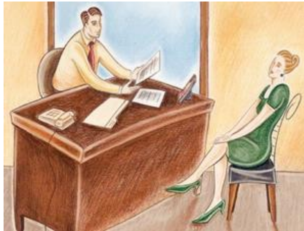
Gambar 12: Menjawab Pertanyaan Sulit Saat Wawancara. (Image by TPG Images).

Wawancara kerja masih jadi momok bagi sebagian besar para pencari kerja. Padahal, dengan sedikit taktik Anda bisa, kok, berkelit dari pertanyaan-pertanyaan "jebakan". Kami bagi rahasianya.